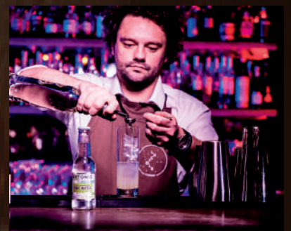
LES DISTRIBUTEURS , LES VENDEURS, LES CONSOMMATEURS