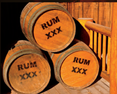
LES FÛTS OU CUVES DE VIEILLISSEMENT