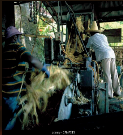
LES USINES DE TRANSFORMATION