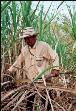
LES PLANTEURS DE CANNE À SUCRE